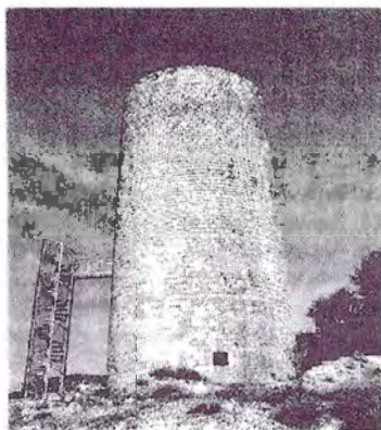
Castell de la Manresana. Foto ECSA – J. Bolòs Catalunya Romànica , vol. XXVII, pàg. 21

La torre d'època preromànica era de fusta o, en algun cas, d'obra. La torre romànica és circular, construïda amb un excel·lent treball de picapedrer. Un bon nombre de torres tenia tres plantes. La porta d'entrada està situada a la planta segona; qualsevol porta ubicada a la planta baixa és posterior i la majoria de les vegades és el resultat d'una recerca de tresors. Aquesta planta baixa tenia una entrada interior des del primer pis i servia com a magatzem. La planta primera o noble era l'habitació del cap o castlà. La tercera planta – segon pis – era l'espai destinat a la residència de la guarnició. Per últim hem d'esmentar el terrat o espai de vigilància. Cal recordar que la majoria de les torres té com a única obertura la porta d'entrada.